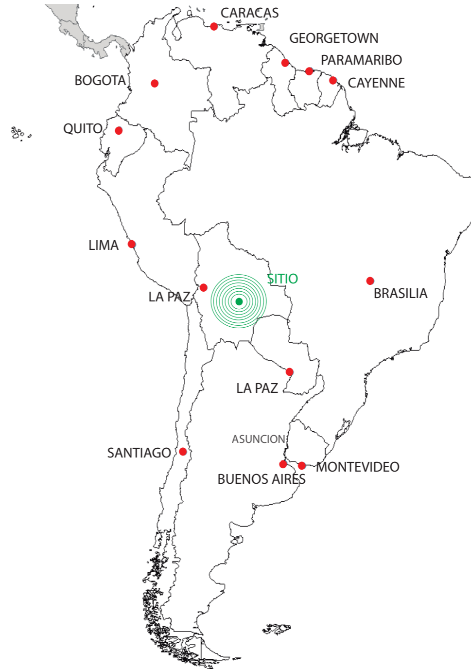
UBICACION DEL SITIO CON RESPECTO A SUDAMERICA. Elaboracion propia.

El terreno se encuentra en las afueras de la ciudad de Santa Cruz de la Sierra, Bolivia, en la localidad de Bermejo, a 100 kilómetros centro urbano más cercano y a una altura de 1200 metros sobre el nivel del mar. Geográficamente, el símbolo para la comunidad sudamericana, se ubica casi en el corazón de Sudamérica, a modo de estar medianamente equidistante a los países miembros de la Confederación.