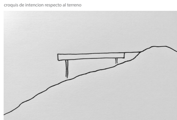
croquis de intención respecto al terreno