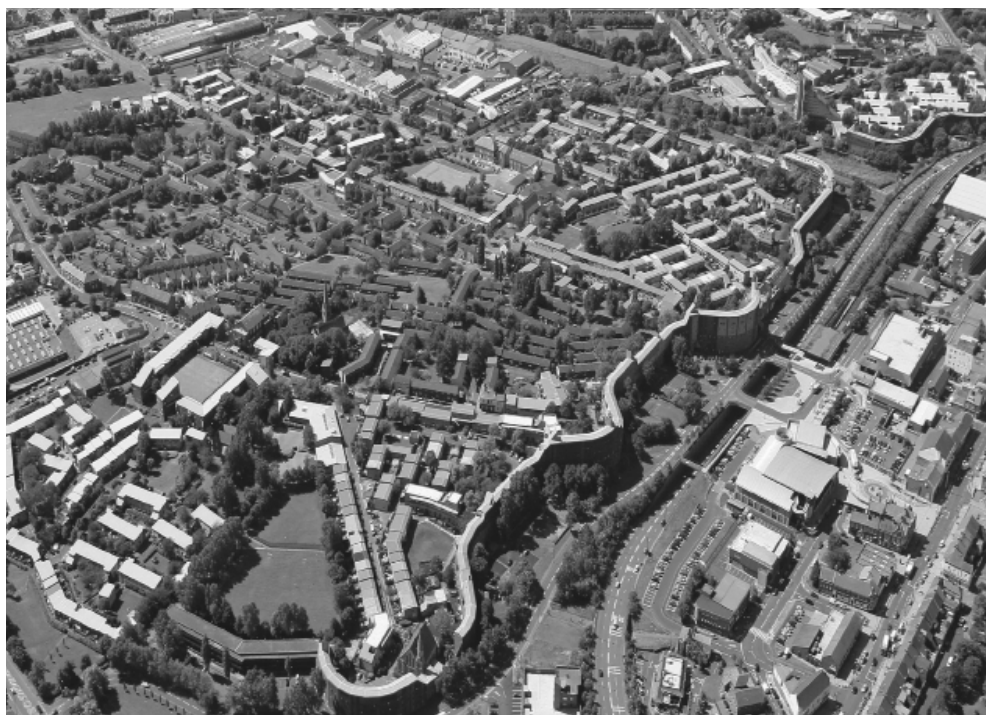
Imagen aérea de Byker. Se distingue el Edificio Perimetral de casi un kilómetro y medio de extensión formando el borde norte y los barrios de baja densidad acompañando la pendiente que desciende hacia el río Tyne, en la parte superior de la imagen. Foto tomada en 2010.