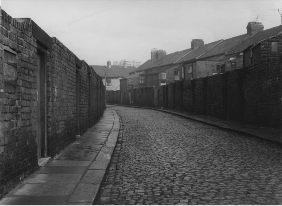
Foto de un callejón de Byker tomada en 1968. Las viviendas obreras existentes habían sido proyectadas en la década de 1870.