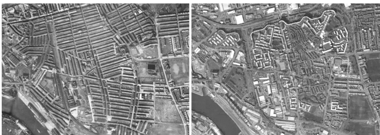
Comparación entre la trama urbana de fines del siglo XIX y la trama proyectada por la oficina de Ralph Erskine para Byker.