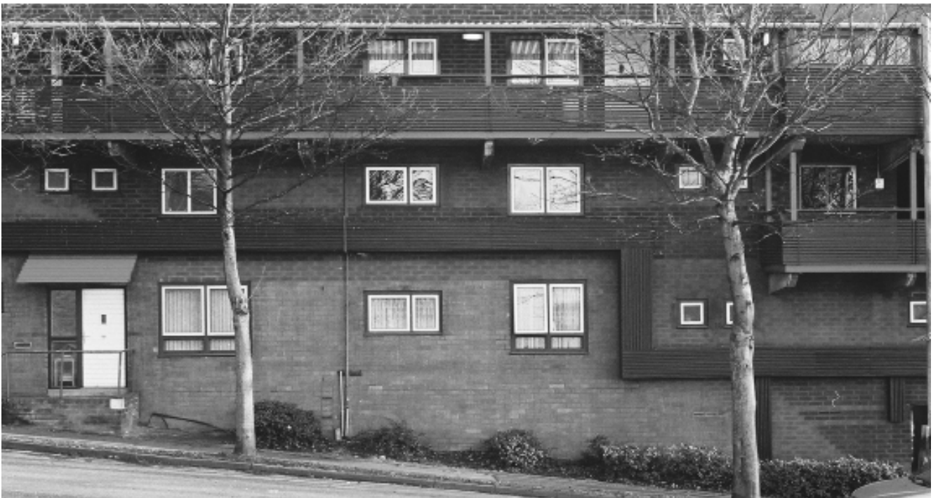
Fachada oeste del Salisbury House, sobre la calle Byker Bank. Foto tomada en 2012. Autor: Julián Varas.