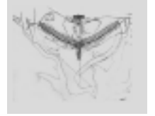
Lúcio Costa, Plano Piloto de Brasilia, 1957.