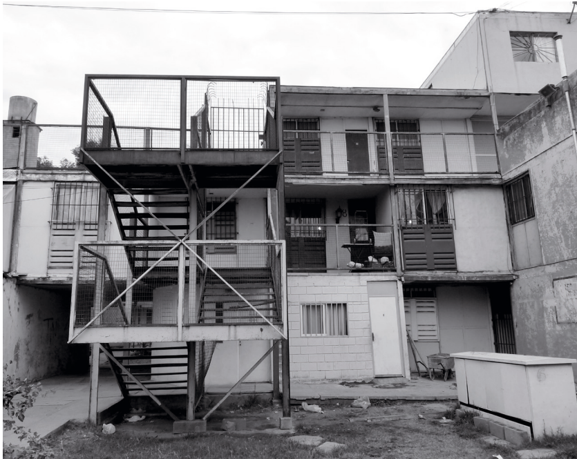
Vista. 2013

Quizás el despliegue del sistema tecnológico utilizado refleje un tardío eco de la manera de abordar el tema de la vivienda de interés social en la segunda posguerra. Queda preguntarnos si esta producción resultó válida en el medio local, inmerso en debates muy distantes a los de la Europa de los años cincuenta que, al tiempo que enfrentaba los desafíos de la reconstrucción, ostentaba un desarrollo en materia industrial mucho más apto para estos desafíos. Si las razones de sus frustraciones fueron producto de desajustes entre diferentes elementos del complejo tejido del sistema, o quizás, de ideas de vanguardia que colisionaron con un medio aún impermeable a estas nuevas propuestas, es algo a profundizar. El actual deterioro del conjunto, producto de su escaso o nulo mantenimiento; la prematura situación de insularidad en materia urbana; las repetidas acciones de compleción por autoconstrucción, que apelan a la flexibilidad pero sin una planificación que gobierne las transformaciones según aquella idea del “todo integrado”; y el habitual desinterés del usuario por los espacios comunes de intercambio que son tierra de nadie; derriban una teoría que sobrevive en su viaje