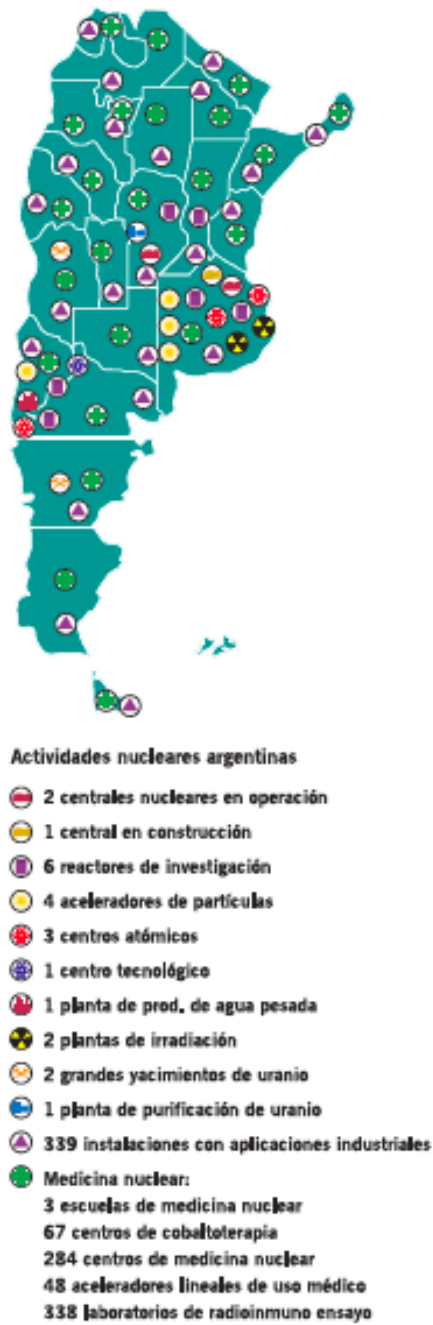
Gráfico 1: Actividades nucleares argentinas.

La presencia de la CNEA a lo largo y a lo ancho del territorio, a través del Plan Nuclear, sus antecedentes y los proyectos asociados pueden observarse a nivel nacional en el siguiente mapa de 2007, en el que se evidencia también la diversidad de campos de acción del núcleo de la trama nuclear argentina: