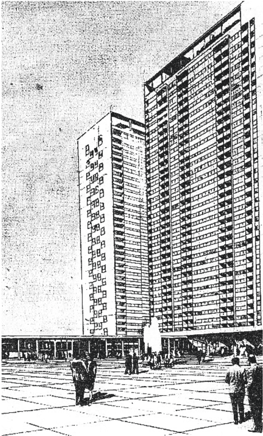
↑ Antonio Bonet, Proyecto Barrio Sur, 1956.