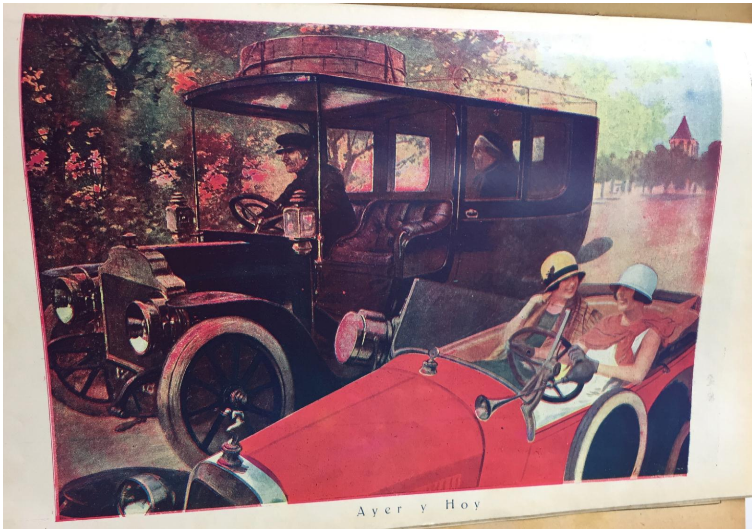
Figura 3: "Ayer y hoy", Femenil , 26/07/1926