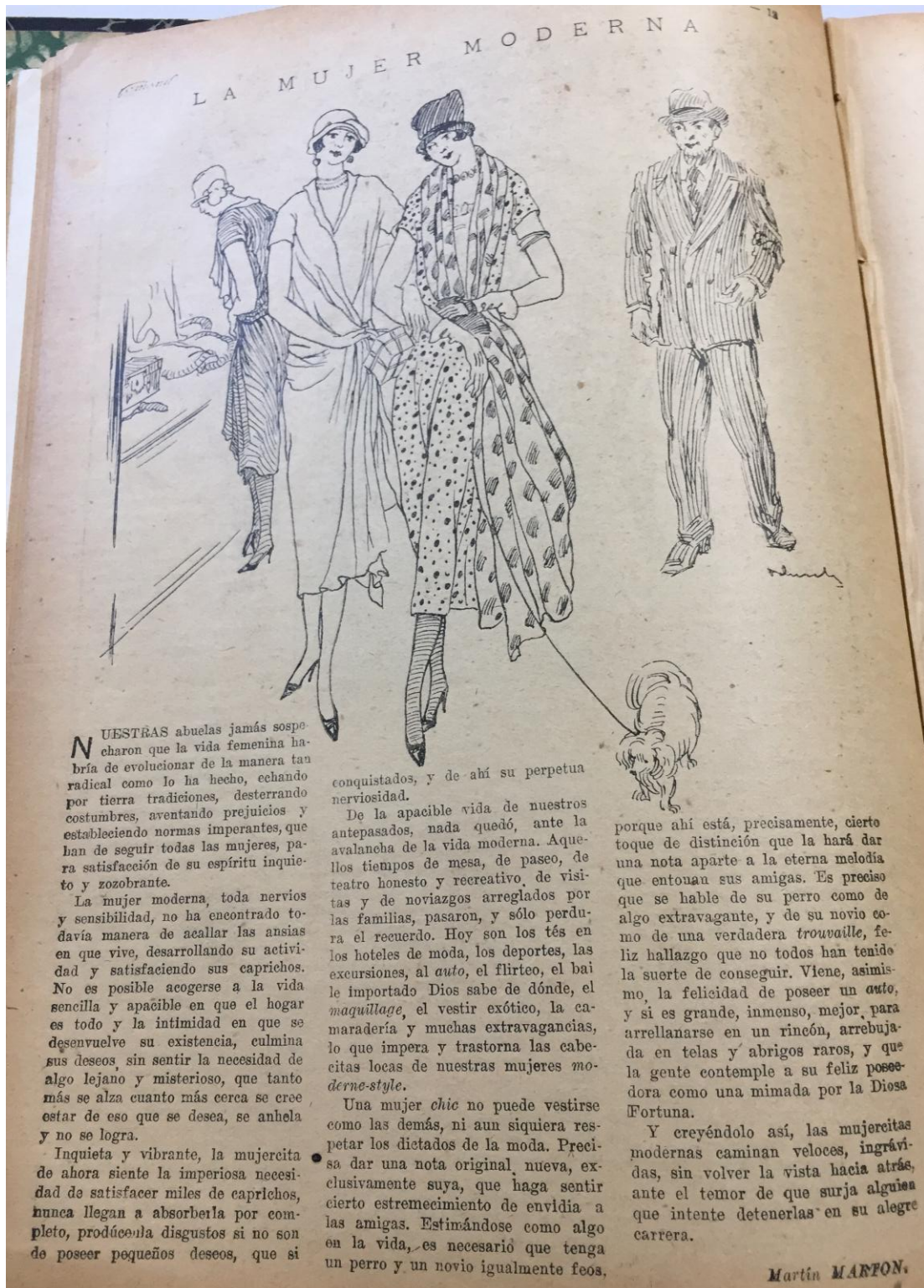
Figura 2: "La mujer moderna", Femenil , 28/09/1925