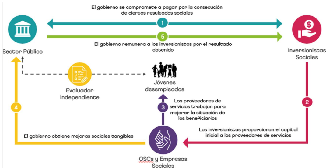
Figura 1: Bono de Impacto Social

La implementación del BIS incluye 5 componentes, como se puede observar en la Figura 1: