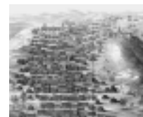
En la tapa: Timbuctú.