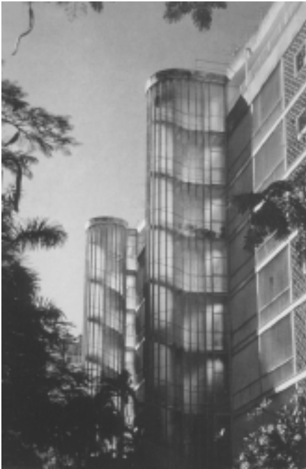
Lúcio Costa, Parque Guinle, 1948-54 ( Registro de uma vivência , cit.).

que debe ser superada. Al contar la historia de los brasileños en su deseo de tener una literatura, Antonio Candido reencontró, en el plano de la vida mental, aquel mismo impulso constructivo responsable por la articulación de lo que llamó sistema literario –un campo de referencias cruzadas acumulativas entre autores, obras y público; la constitución, en fin, de una continuidad literaria a través de la que pasaría, por el filtro de las formas, el sentimiento del país. En la comparación obligatoria que se establecía con la norma europea a la que se aspiraba, pasaría también el sentimiento del mundo, exaltado o rebajado por el localismo hasta el momento en que el equilibrio entre ambos sería alcanzado en la obra de Machado de Assis, cuando se completa la «formación» del sistema . Como la literatura había ocupado un lugar central en la organización de la experiencia nacional en el siglo XIX, en tanto factor de revelación del país, Antonio Candido