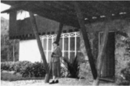
Lúcio Costa, Park Hotel, Friburgo, 1940 (fotografía utilizada por Mário Pedrosa para su exposición en París).