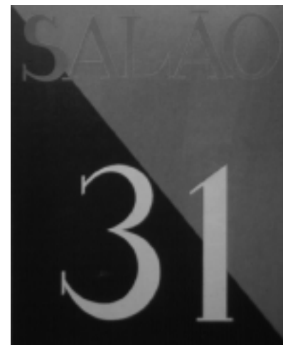
Afiche del Salón de 1931.

de los embriones de lo que se podría llamar efecto retroactivo del proceso de formación que busca completarse por influjo moderno necesariamente externo y por ello mismo preponderante, como veremos enseguida. Primera versión de la futura «liberación localista» de la que hablará nuestro gran crítico literario, Antonio Candido. O mejor, en el lenguaje también psicoanalítico de otro precursor no menos ilustre, Gilberto Freyre, que en 1926 exalta la necesidad de destapar o «destabuizar» el Brasil encubierto por la mentira oficial, postizo. En fin, una cura psicoanalítica que acabara con todas las coartadas (por ejemplo, la indianista mientras se revela el Brasil real, «negro»).