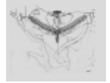
Lúcio Costa, Plano Piloto de Brasilia, 1957.