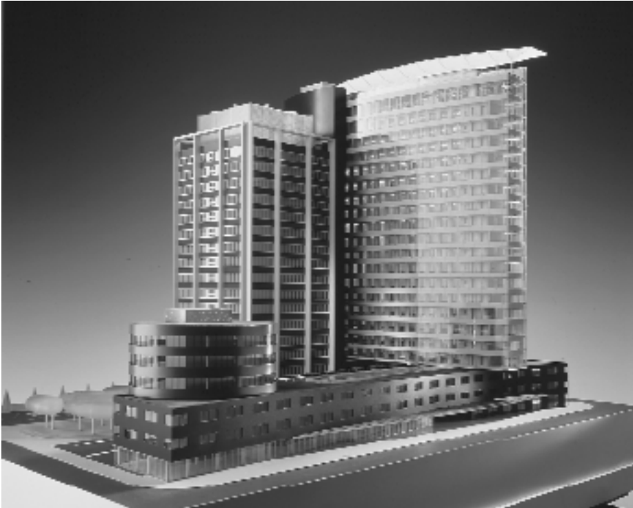
Sauerbruch-Hutton: Casa Cental GSW. Maqueta, fachada noroeste. Berlín.