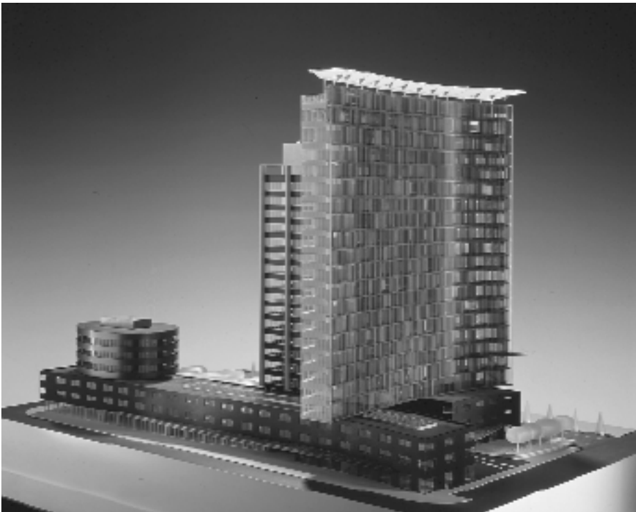
Maqueta, fachada noreste.