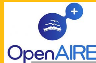
For Literature Repositories (2013)