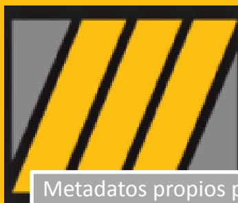
Metadatos propios para la gestión